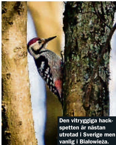
Den vitryggiga hackspetten är nästan utrotad i Sverige men vanlig i Białowieża.

Skansen hade möjlighet att få en viktig roll i räddningen av visenterna redan under 1930-talet. Det var två kor som skickades till avel men visade sig ha lite amerikanskt bisonblod i sig och mönstrades ut. Dessutom skickades den renrasiga tjuren Björnson 1935 till avelsanläggningen i Białowieża för att tillföra nya gener. Tyvärr blev han stängad till döds av den dominanta tjur