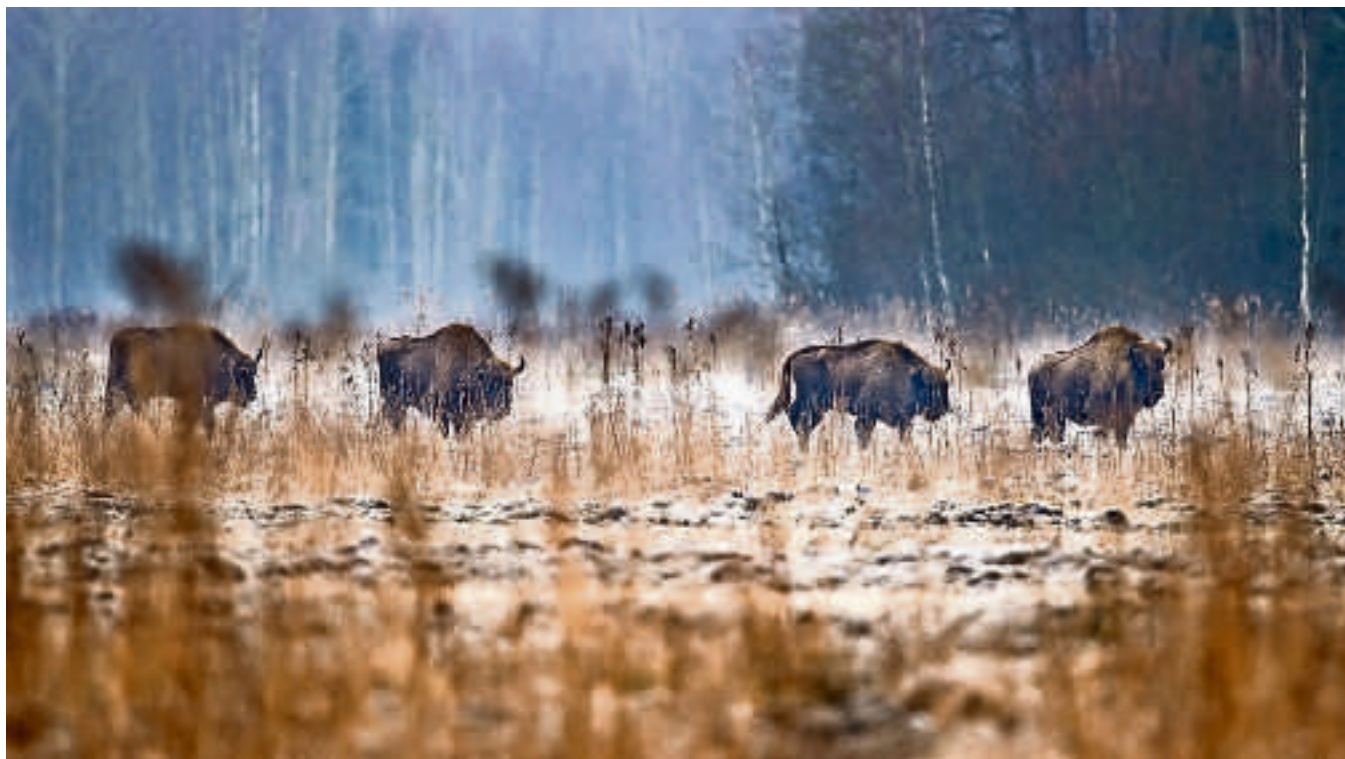
FRIA. Numera kan man åter se Europas största däggdjur, visenten, vandra över öppna fält i östra Polen.

han skulle ersätta. Helt utan roll blev han dock inte utan han får nu pryda en av lokalerna i nationalparkens besökscentrum.