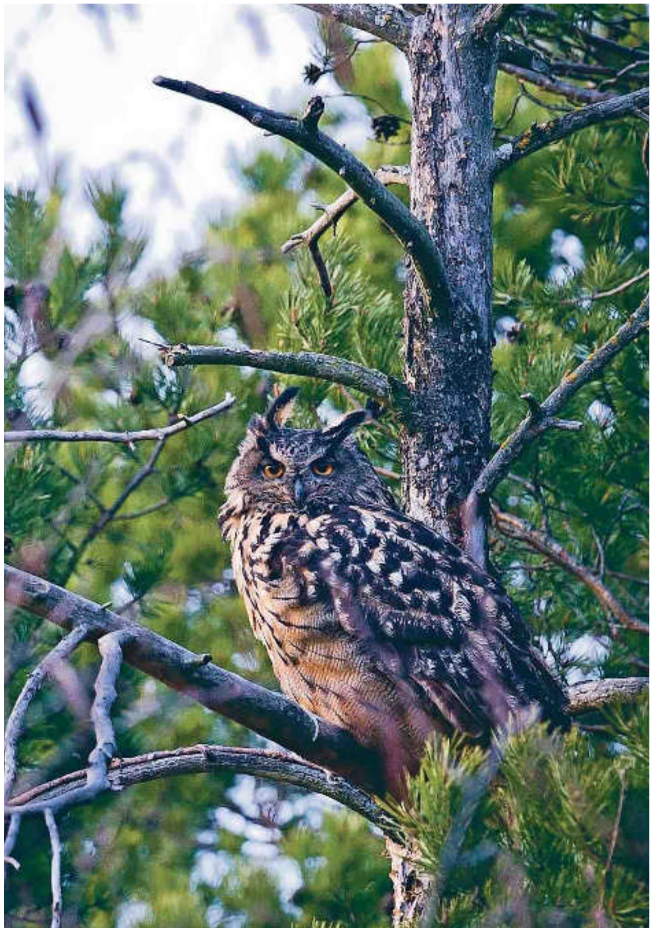
BARA 1 000 UVAR KVAR. Efter många års ökning, bland annat genom uppfödning, minskar sedan flera år antalet berguvar. I Artdatabankens nya rödlista över hotade arter betraktas den som Sårbar, en hotgrad högre än i förra rödlistan från 2010.

Rolf Segerstedt 070-521 52 60 rolf.segerstedt@landlantbruk.se